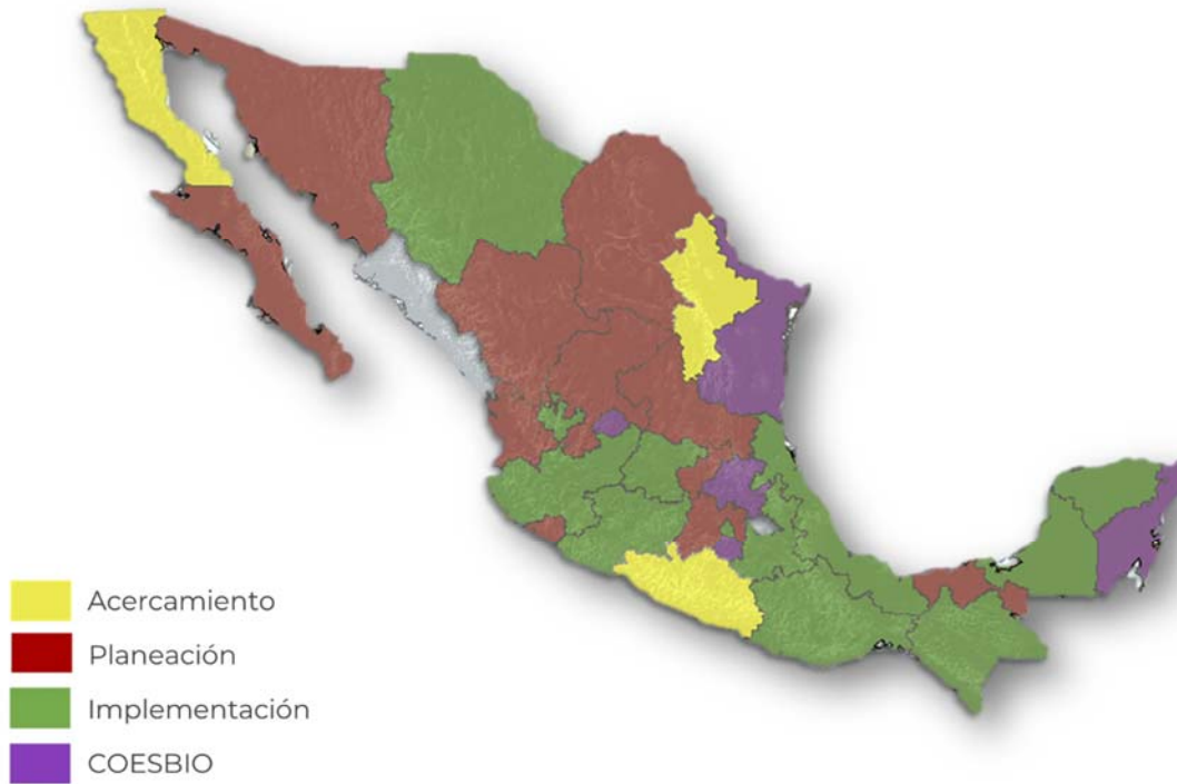
Figura 2. Estados del país que participan en la iniciativa de Estrategias Estatales de Biodiversidad. Los estados que están en proceso de elaborar sus documentos de planificación (rojo); los que han finalizado sus estrategias y se encuentran en fase de implementación (verde); y estados que cuentan con su Comisión Estatal de Biodiversidad (morado). Última actualización del mapa febrero 2022.