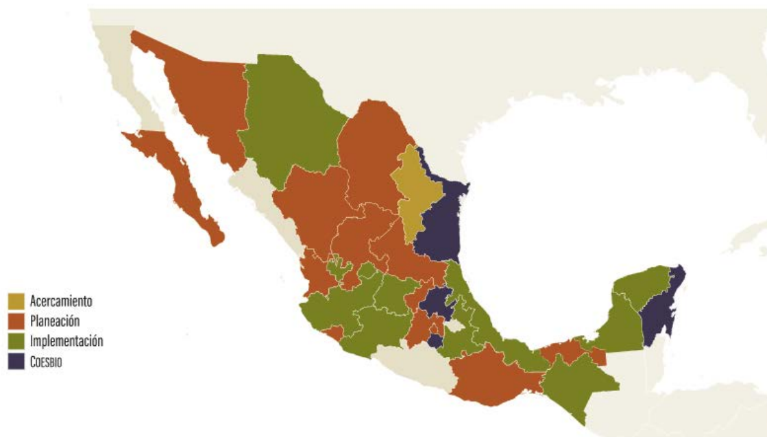
Figura 2. Estados del país que participan en la iniciativa de Estrategias Estatales de Biodiversidad. Los estados con los que ha habido acercamiento (amarillo), los que están en proceso de elaborar sus documentos de planificación (rojo); los que han finalizado sus estrategias y se encuentran en fase de implementación (verde); y estados que cuentan con su Comisión Estatal de Biodiversidad (morado). Última actualización del mapa abril 2021.