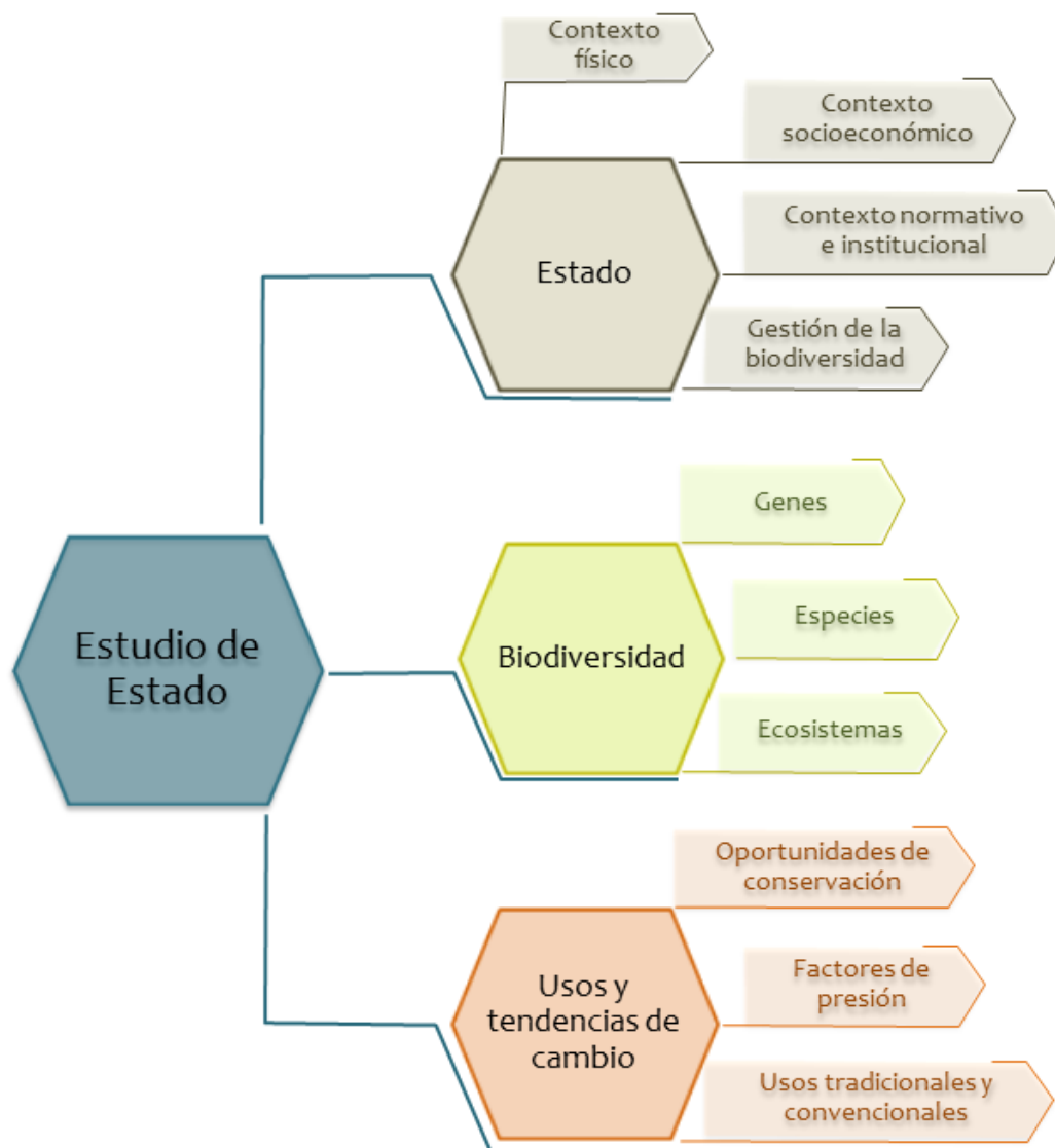
Figura 1. Representación esquemática de los temas abordados en el Estudio de Estado.

A continuación se desglosa la estructura general de los Estudios de Estado dividiendo el contenido en tres temáticas principales: Estado, Biodiversidad y Usos y tendencias de cambio (figura 1). Se presentan también las secciones con una serie de preguntas para guiar el desarrollo del contenido general y particular. Es importante considerar a la biodiversidad como un tema transversal en toda la obra .