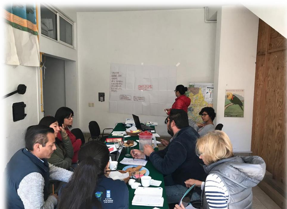
Fotografía 1. Ejercicio de construcción del árbol de problemas durante la reunión realizada en las oficinas del APRN Valle de Bravo.

Estos insumos serán la base para identificar las acciones preventivas, de control y/o erradicación que deberán ser contempladas en el Plan de Manejo de EEI para el APRN Valle de Bravo.