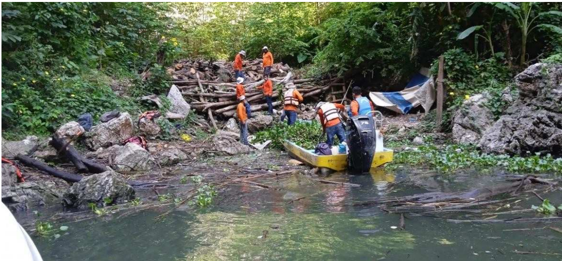
Imagen 15. Trabajos para el manejo de los residuos sólidos en el PNCS.

Como parte de las actividades de la Reunión, se realizó un recorrido fluvial por el PNCS, a fin de conocer otras actividades que se realizan como parte del manejo del ANP.