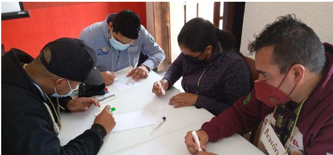
Imagen 3: Identificando a las especies nativas y exóticas que habitan en el ANP, (Fotografía: SOS, 2021)