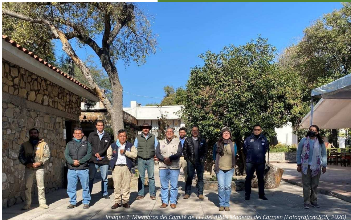
Imagen 1. Miembros del Comité de EEL del APRN Maderas del Carmen