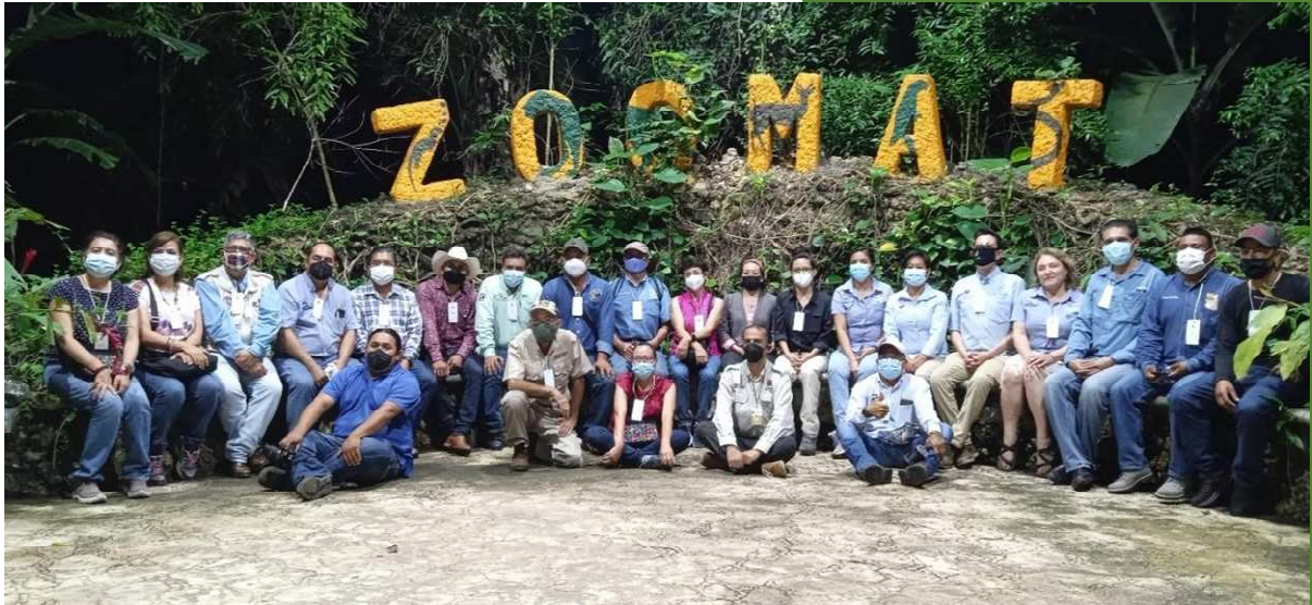
Imagen 1. Participantes de la Reunión