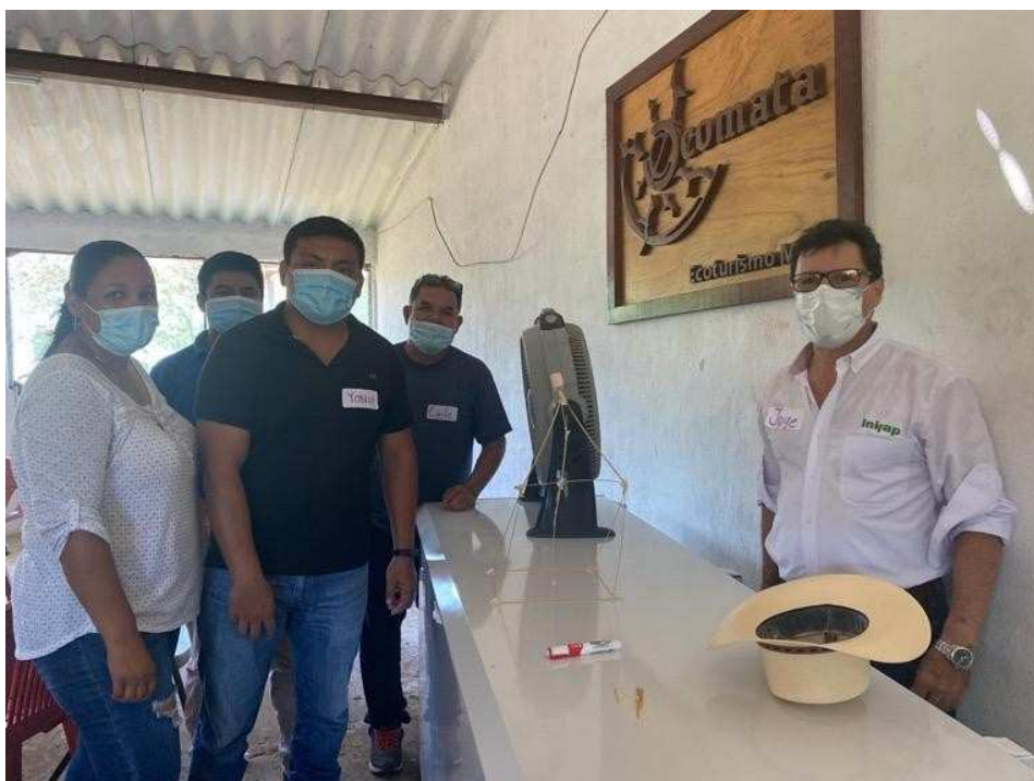
Imagen 7: Actividad de la torre