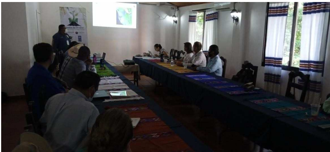
Imagen 13. Presentación del Representante del CEEI de la RB Marismas Nacionales Nayarit (Fotografía: SOS,