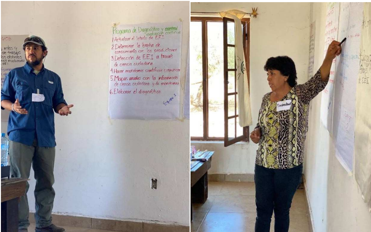
Imagen 6: Presentación de actividades identificadas para cada meta