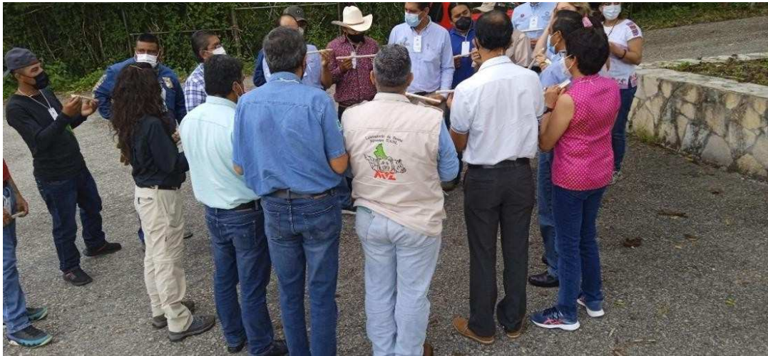
Imagen 8. Participantes organizándose para el reto.