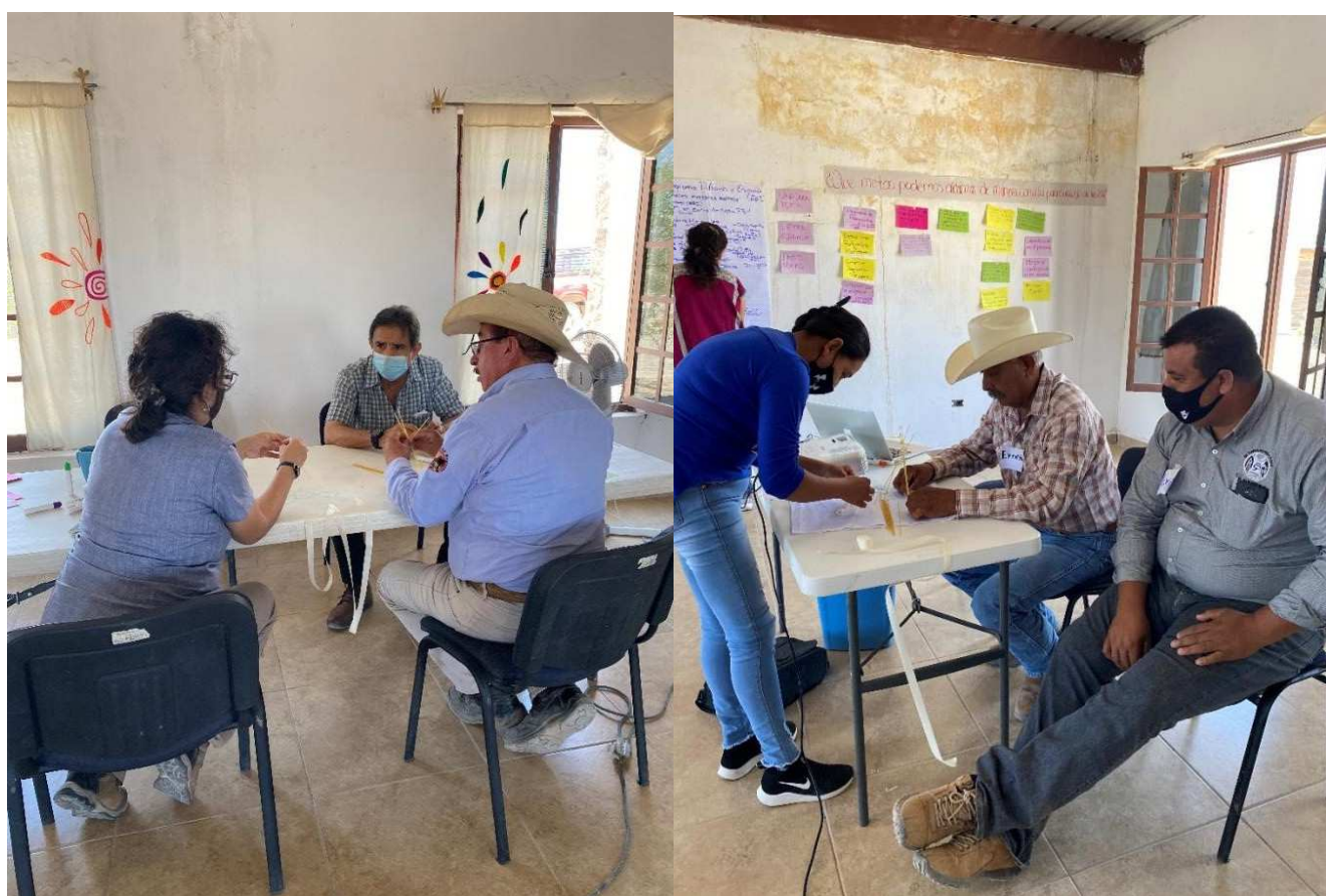
Imagen 7: Actividad de Spaguetti y el marshmallow

La reflexión del ejercicio giró en torno a lo que sucede cuando se trabaja en equipo, bajo un buen liderazgo, colaboración y comunicación eficiente.