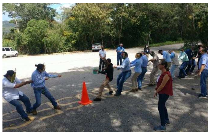
Imagen 6. Actividad de la cuerda. Actividad adaptada por SOS

Con el fin de señalar los objetivos de la reunión y motivar la apertura al diálogo en los dos días de trabajo, se realizó la dinámica de la cuerda, la cual consistió en presentar algunas de las especies invasoras en las ANP como son el carrizo, los perros ferales, el zacate rosado, la trucha arcoíris, así como la apatía, la ignorancia, y el cambio climático. Por otra parte, se preguntó que actores qué necesitaban para combatirlas, y se presentaron los directores de las ANP, los académicos, las organizaciones civiles, las instituciones gubernamentales, pero también la comunicación, el liderazgo y la sabiduría para poder interactuar los conocimientos y las experiencias para poder combatir a las especies invasoras y restaurar los ecosistemas de México.