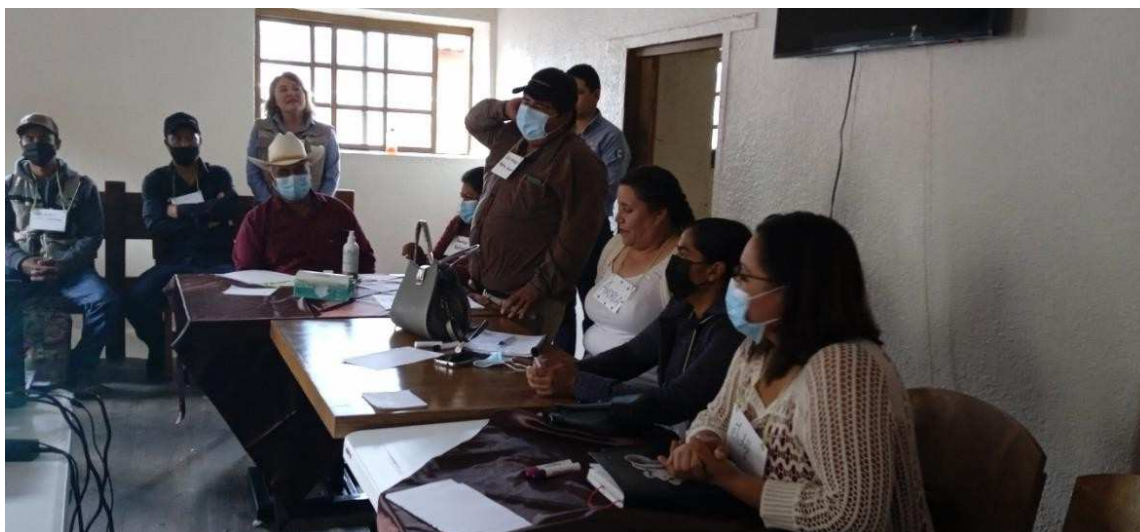
Imagen 2: Presentación de los asistentes al taller

Acto seguido se realizó la prestación de los asistentes indicando su nombre y la institución o comité de participación social que representan.