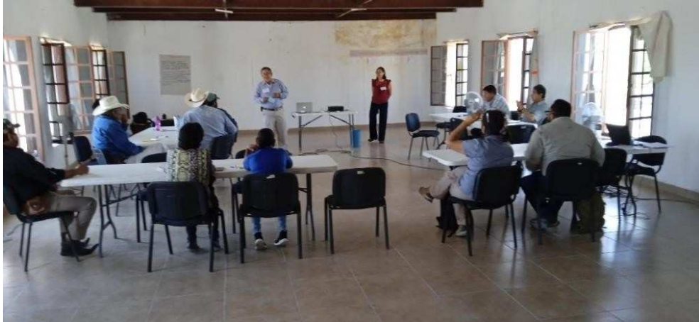
Imagen 2: Palabras de bienvenida al taller por parte del Director del ANP

Acto seguido se realizó la presentación de cada uno de los asistentes indicando: