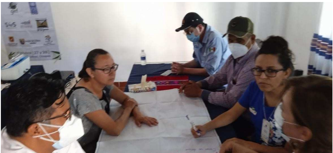
Imagen 18. Mesa 3 del café Mundial.