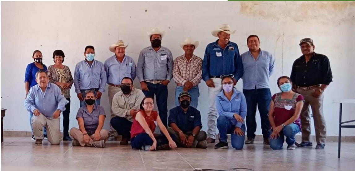
Imagen 1. Participantes del taller