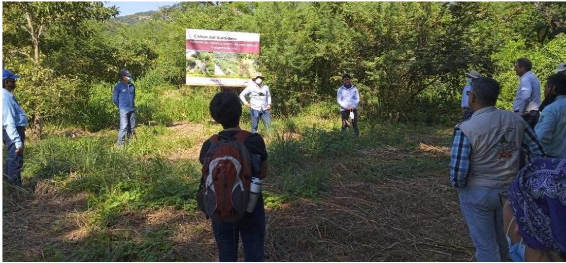
Imagen 14. Recorrido en sitios de trabajo con pasto jaragua

Como parte de las actividades de la Reunión, se realizó un recorrido fluvial por el PNCS, a fin de conocer otras actividades que se realizan como parte del manejo del ANP.