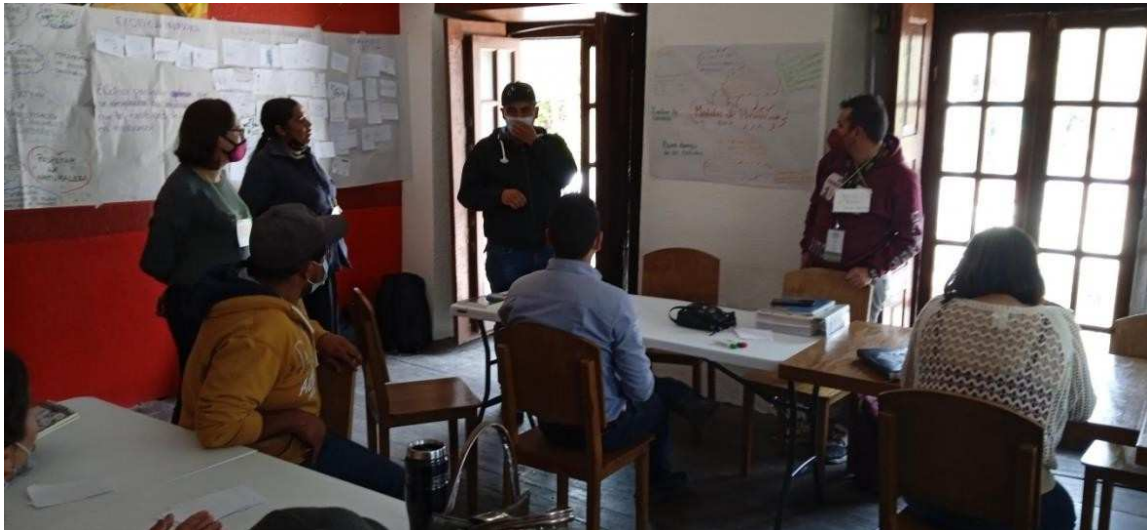
Imagen 6.: Presentación de propuestas de cada uno de los equipos