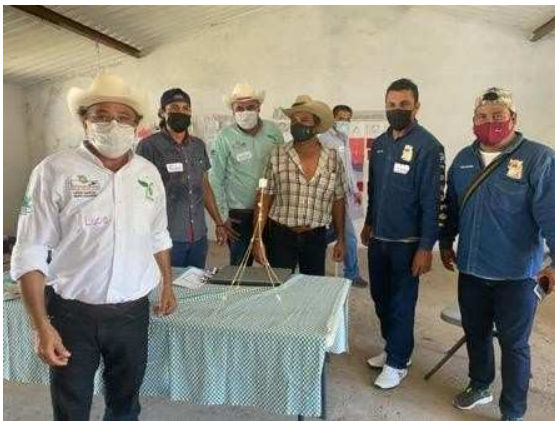
Imagen 5: Armando la torre

Con el objetivo de generar procesos de liderazgo y de comunicación necesarios en la conformación de los comités, y que impactan en el funcionamiento de estos, se llevó a cabo la actividad del “Spaguetti y el marshmallow”, cuyo objetivo es construir la estructura más alta (“freestanding”), misma que debía sostenerse de pie al menos durante treinta segundos. Para ello se dividió a los participantes en cuatro equipos, para realizar el reto los participantes únicamente podrían utilizar los materiales proporcionados: 20 spaguettis, cinta masking tape, hilo y un bombón mediano.