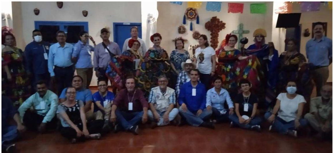
Imagen 21. Cierre de la reunión con un evento cultural.

Finalmente se hizo entrega de los diplomas de reconocimiento a cada uno de los participantes, para dar paso al cierre de la Reunión con un evento cultural.