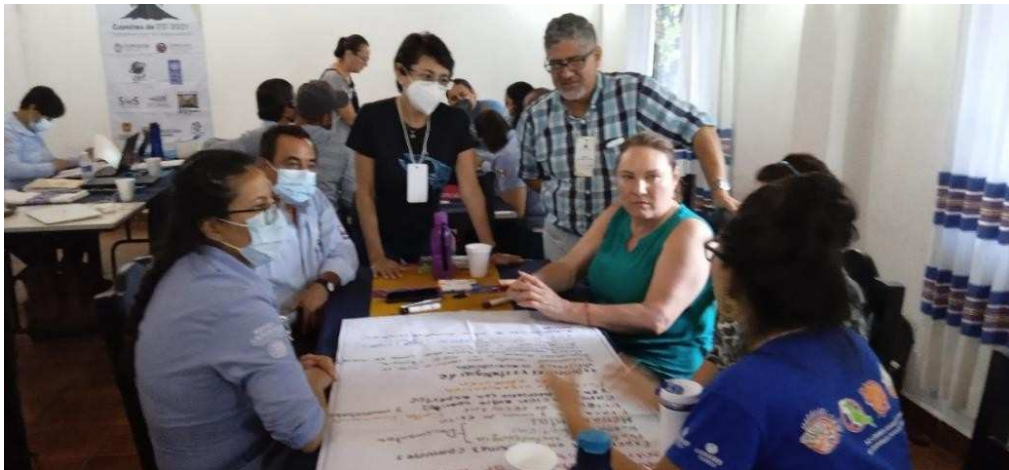
Imagen 17. Mesa 2 del café Mundial.