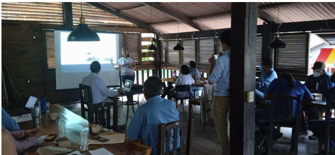
Imagen 11. Presentación de la Representante del CEEI de la RBLT.