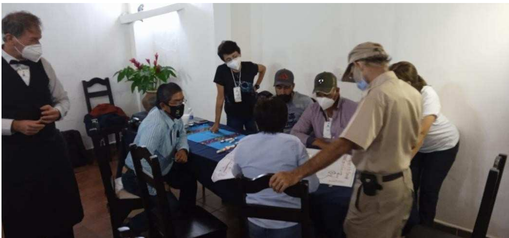
Imagen 20. Mesa 4 del café Mundial.

Una vez que los participantes vertieron sus aportaciones en cada una de las mesas las ideas propuestas fueron presentadas en plenaria por cada uno de los moderadores de las mesas. Posteriormente el facilitador pidió a los participantes elegir una de las ideas plasmadas en la mesa uno sobre los posibles acuerdos para colaborar en el futuro en los participantes, siendo la idea con más votos la siguiente: Red de comités de EEI en ANP (Facebook, WhatsApp con reglas) , con un total de 12 votos.