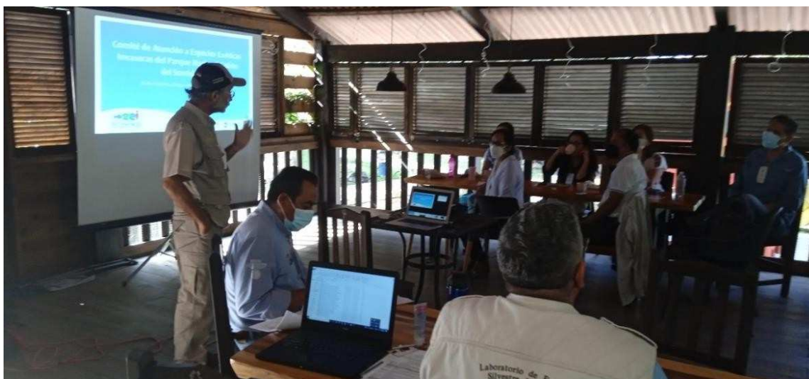
Imagen 10. Presentación del Representante del CEEI del PNCS.