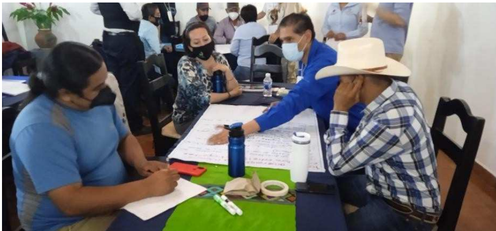
Imagen 16. Mesa 1 del café Mundial.