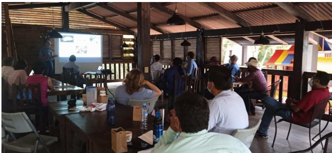
Imagen 12. Presentación del Representante de la RB El Vizcaíno.