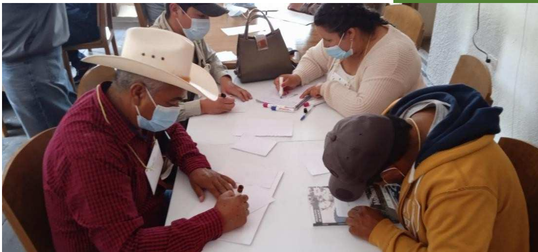
Imagen 1. Participantes del taller (SOS, 2021)