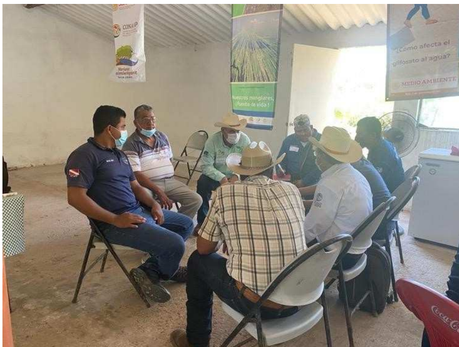
Imagen 6 : Ejidatarios participando en una de las dinámicas