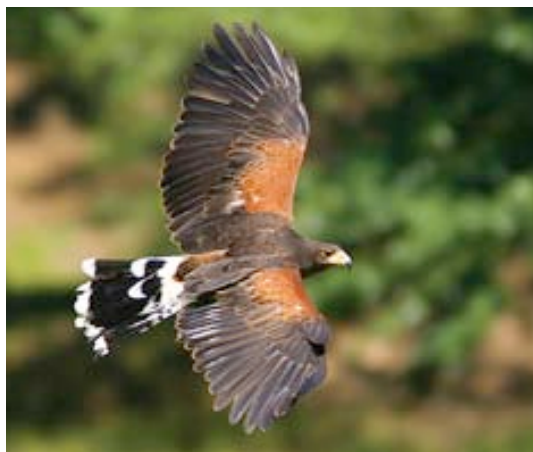
El ratón casero ( Mus musculus ) originario de Europa, y la aguililla rojinegra ( Parabuteo unicinctus ) trasladada al Valle de México debido a actividades de cetrería.