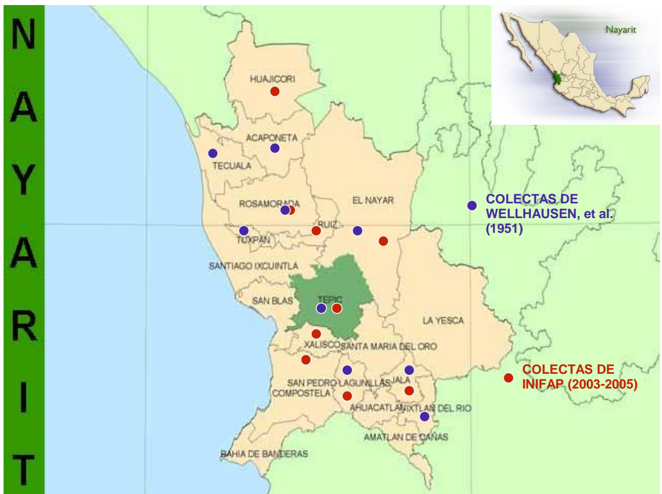
Figura 1. Ubicación de sitios donde se han colectado maíces nativos en el estado de Nayarit. 2008.

detener su erosión genética y preservar la riqueza fitogenética e identidad de dicho germoplasma, mediante manejo y conservación participativa in situ y ex situ . A la fecha, las colectas realizadas en Nayarit por el INIFAP en colaboración con la Universidad Autónoma de Nayarit (Ortega C. et al , 2006), comprenden 42 muestras, 31 pertenecen a la raza Tabloncillo, dos a Jala, tres a Tabloncillo Perla, una a Blandito, dos a Elotes Occidentales y tres a Bofo. En la Figura 1 se muestra la ubicación de estas colectas y de las realizadas por Wellhausen et al. (1951).