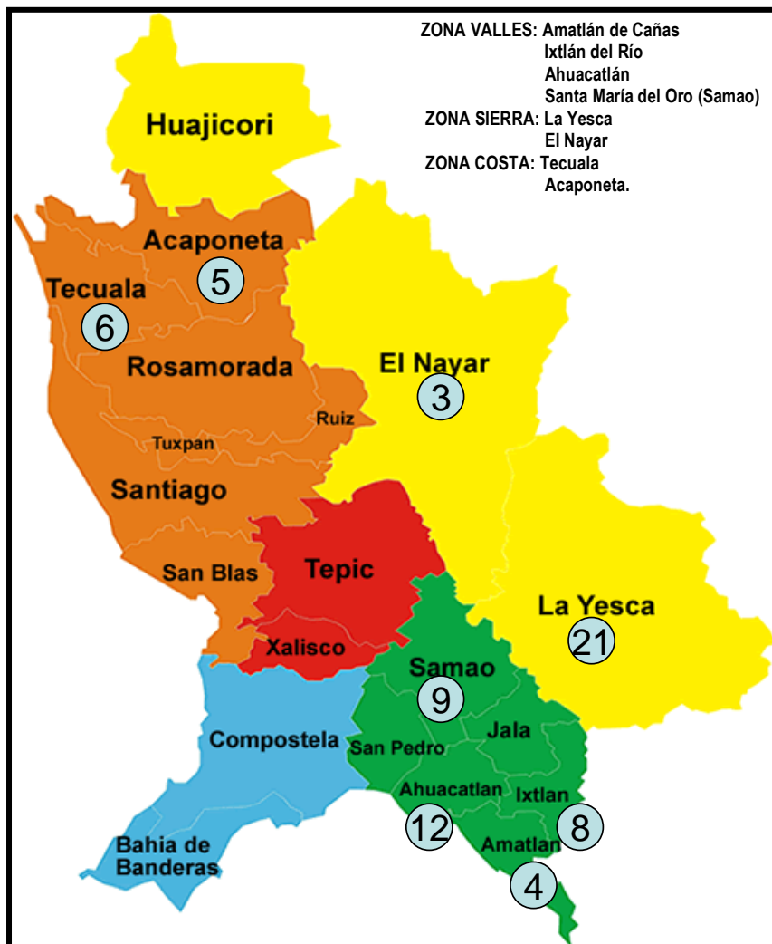
Figura 3. Cantidad de muestras de Maíces Nativos colectados por Municipio en el Estado de Nayarit. INIFAP. 2008.

6.3. Información del Ejemplar (Pasaporte). La información de cada una de los 68 muestras colectadas en ocho municipios del Estado de Nayarit, fue registrada en los correspondientes pasaportes con la información respectiva de identificación de colecta y colectores, ubicación geográfica, nombre de agricultor, descripción de colecta, datos de mazorca y grano y manejo agronómico.