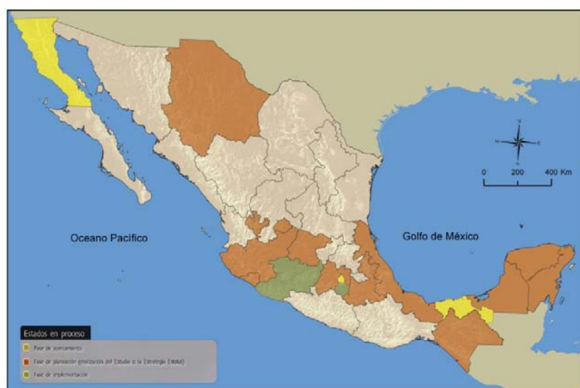
Figura 2. Estados de la República Mexicana que han terminado de elaborar sus documentos de planificación y están en fase de implementación (verde); que han iniciado trabajos de las estrategias estatales sobre biodiversidad (naranja), y estados que han expresado interés por iniciar los procesos (amarillo).