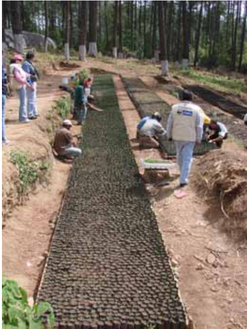
Almácigo de plántulas para reforestación.