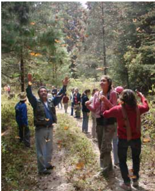
Visitantes en la Reserva.