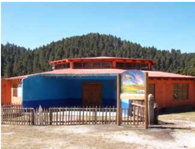
Centro de interpretación, Reserva de la Biosfera Mariposa Monarca.

lancia comunitaria y se instaló un vivero forestal, y los resultados en 2009 fueron la reducción de la deforestación en esta zona (FCMM, 2009).