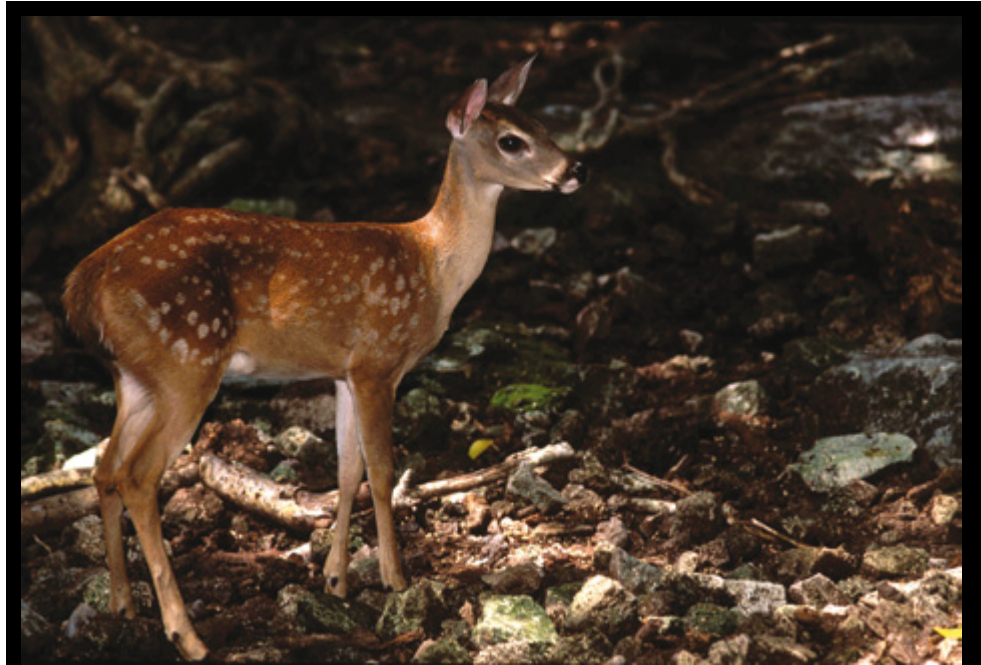
Venado Cola Blanca ( Odocoileus virginianus ), Puerto Morelos, Quintana Roo