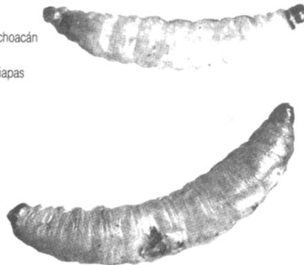
Las fotografías que ilustran este artículo fueron tomadas del libro Presencia de la comida prehispánica editado por Fomento Cultural Banamex, A.C.