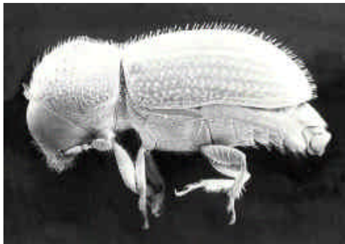
Existen tres especies de betílidos que parasitan a la broca, que es considerada como la principal plaga del cultivo del café en todo el mundo. En la figura se muestra una hembra adulta de la broca.

Esta familia evolucionó explotando hospederos que vivían en situaciones crípticas, tales como insectos barrenadores de tallos y troncos, enrolladores de hojas, insectos que viven en el suelo, perforadores de semillas (gorgojos), etc. Todas las especies de betílidos que se conocen en la actualidad son ectoparasitoides primarios de larvas y pupas de Coleoptera y Lepidoptera que se encuentran en situaciones ocultas, como las arriba mencionadas. Son contados los casos en los que atacan a otros insectos fuera de estos órdenes; un ejemplo de ello es