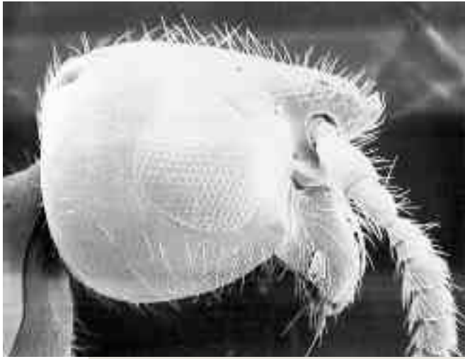
Figura 5. Prorops nasuta es otro betílido parásito de la broca del café que ha sido introducido a nuestro país.