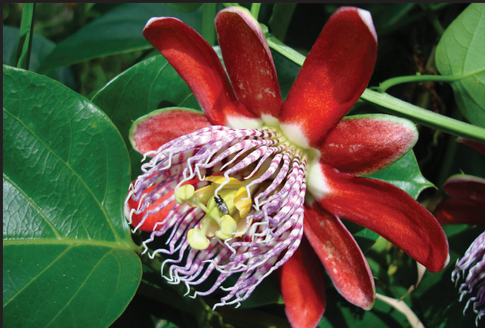
Flor de la Pasión ( Passiflora quadrangularis )