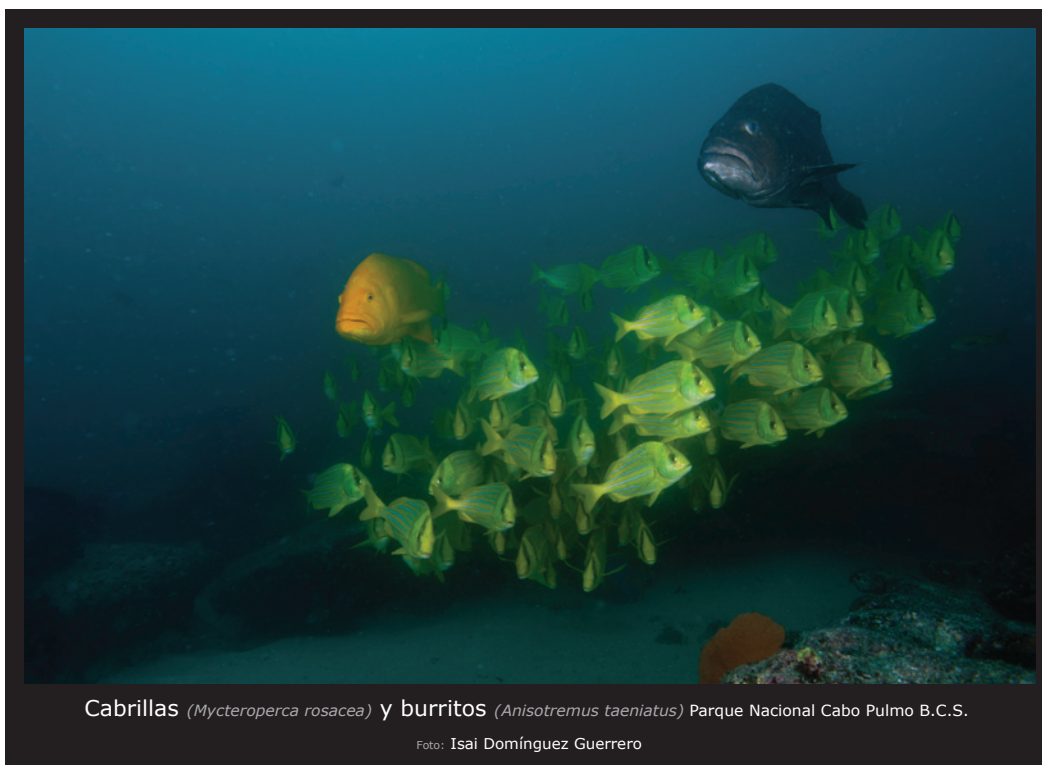
Cabrillas ( Mycteroperca rosacea ) y burritos ( Anisotremus taeniatus ) Parque Nacional Cabo Pulmo B.C.S.