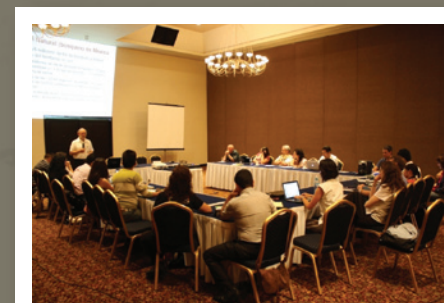
Taller Red Mexicana de Periodistas Ambientales, Center for International Forestry Research (CIFOR) y la CONABIO