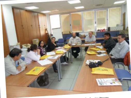
Reunión en la Coordinadora de Organizaciones de Agricultores y Ganaderos (COAG) Sevilla, España.