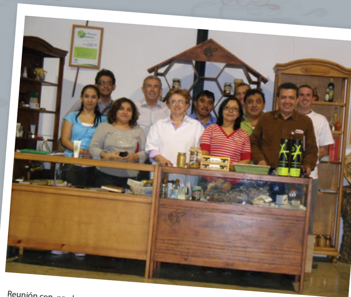
Reunión con productores en una envasadora en Montoro, Córdoba - España.

Nov. 9 al 13 Se realizó la 1ª Conferencia Iberoamericana de Reservas de la Biósfera en Puerto Morelos, Quintana Roo. Las conclusiones de esta reunión se integrarán para crear el Programa Iberoamericano de Reservas de la Biósfera.